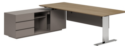
ПИСЬМЕННЫЙ СТОЛ С ЛЕВОЙ ТУМБОЙ ( БЕЗ ФУНКЦИИ ПОДЪЕМА ) ( SN2018-L ) Ш: 200 / Г: 180 / В: 75