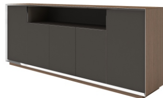
ШКАФ-ГРЕДЕНЦИЯ С 4-МЯ ДВЕРКАМИ ( WNS1508 ) Ш: 157,2 / Г: 40 / В: 80