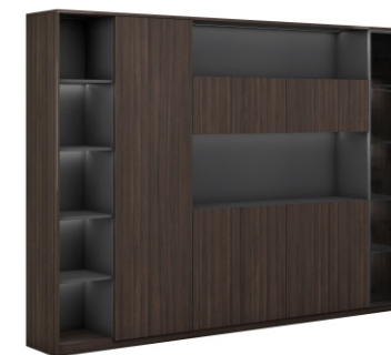
ШКАФ С ПОДСВЕТКОЙ ( XCEO02820-A ) Ш: 280 / Г: 40 / В: 200