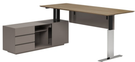
ПИСЬМЕННЫЙ СТОЛ С ЛЕВОЙ ТУМБОЙ ( С ФУНКЦИЕЙ ПОДЪЕМА ) ( SN2018Z-L ) Ш: 200 / Г: 180 / В: 75