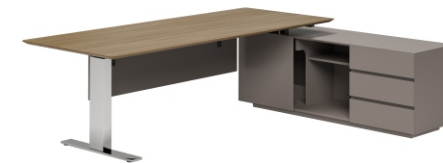
ПИСЬМЕННЫЙ СТОЛ С ПРАВОЙ ТУМБОЙ ( БЕЗ ФУНКЦИИ ПОДЪЕМА ) ( SN2018-R ) Ш: 200 / Г: 180 / В: 75