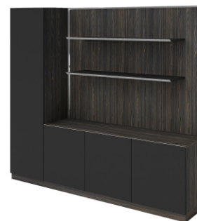
ШКАФ С ОТКРЫТЫМИ ПОЛКАМИ И ГАРДЕРОБОМ ( WNS2118W ) Ш: 215 / Г: 40 / В: 180