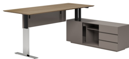
ПИСЬМЕННЫЙ СТОЛ С ПРАВОЙ ТУМБОЙ ( С ФУНКЦИЕЙ ПОДЪЕМА ) ( SN2018Z-R ) Ш: 200 / Г: 180 / В: 75