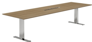
КОНФЕРЕНЦ-СТОЛ ( SN2009 ) Ш: 220 / Г: 90 / В: 75