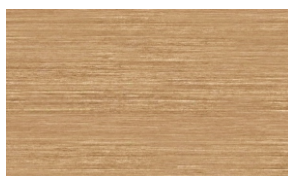
ШПОН КОФЕЙНЫЙ ОРЕХ ( TA29YA )