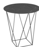
СТОЛИК ЖУРНАЛЬНЫЙ (LC 035-2) Ш: 50 / Г: 50 / В: 50