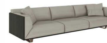
ДИВАН (ES04.3) Ш: 316 / Г: 93 / В: 76