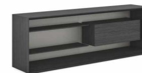
ГРЕДЕНЦИЯ (EZ50(1640)) Ш: 160 / Г: 400 / В: 750