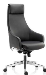
КРЕСЛО (ГАУДИ) Ш: 67 / Г: 66 / В: 120