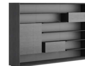
ШКАФ (EZ90 (3150)) Ш: 319 / Г: 50 / В: 203,6 (EZ90 (3350)) Ш: 339 / Г: 50 / В: 203,6 (EZ90 (3550)) Ш: 359 / Г: 50 / В: 203,6