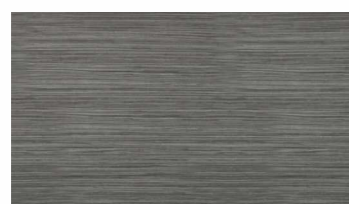
ШПОН Римский дуб (TA24YA)