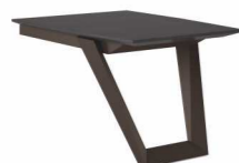
СТОЛ-БРИФИНГ (EZ80 (1395)) Ш: 130 / Г: 95 / В: 72