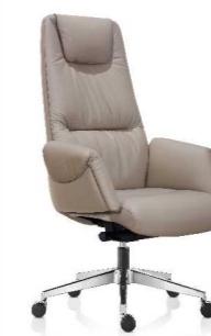
КРЕСЛО (БЕНУА) Ш: 75 / Г: 74 / В: 115