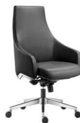
КРЕСЛО (ГАУДИ-М) Ш: 67 / Г: 66 / В: 103