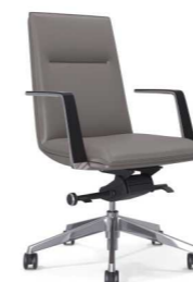
КРЕСЛО (ВОЛЬТЕР-М) Ш: 63 / Г: 64 / В: 950