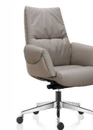
КРЕСЛО (БЕНУА-М) Ш: 75 / Г: 74 / В: 103