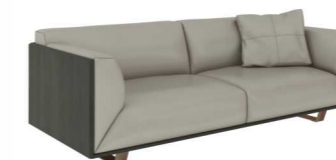
ДИВАН (ES04.2) Ш: 226 / Г: 93 / В: 76