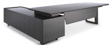
СТОЛ С БОКОВОЙ ТУМБОЙ (EZ80 (2420)) Ш: 240 / Г: 200 / В: 76 (EZ80 (2620)) Ш: 260 / Г: 200 / В: 76 (EZ80 (2824)) Ш: 280 / Г: 240 / В: 76 (EZ80 (3024)) Ш: 300 / Г: 240 / В: 76 (EZ80 (3224)) Ш: 320 / Г: 240 / В: 76