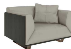
КРЕСЛО (ES04.1) Ш: 110 / Г: 93 / В: 76