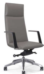
КРЕСЛО (ВОЛЬТЕР) Ш: 63 / Г: 64 / В: 116