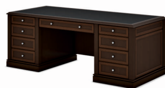
СТОЛ РУКОВОДИТЕЛЯ 2050 (INT101) Ш: 205 / Г: 90 / В: 76,8