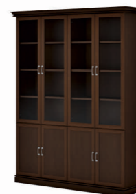
ДВА ШКАФА КОМБИНИРОВАННЫХ (INT501) Ш: 192 / Г: 49,3 / В: 240