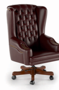
КРЕСЛО ЧЕЛЛИНИ (DL-051) Ш: 82 / Г: 80 / В: 130