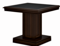
ПРИСТАВКА К СТОЛУ РУКОВОДИТЕЛЯ (INT105) Ш: 90 / Г: 90 / В: 76,8