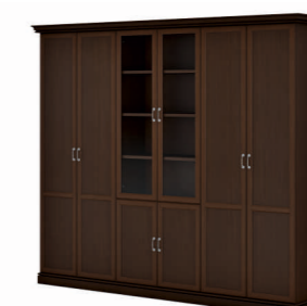
ДВА ГАРДЕРОБА И ШКАФ КОМБИНИРОВАННЫЙ (INT503) Ш: 282,1 / Г: 49,3 / В: 240