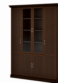
ШКАФ КОМБИНИРОВАННЫЙ, УЗКИЙ ШКАФ И ГАРДЕРОБ (INT505) Ш: 192 / Г: 49,3 / В: 240