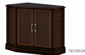
ПРИСТАВКА УГЛОВАЯ ПРАВАЯ (INT107DX) Ш: 90 / Г: 55 / В: 76,8 ПРИСТАВКА УГЛОВАЯ ЛЕВАЯ (INT107SX) Ш: 90 / Г: 55 / В: 76,8