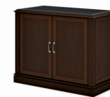
ГРЕДЕНЦИЯ 1050 (INT301) Ш: 150 / Г: 55 / В: 82,8 топ с кожаной вставкой