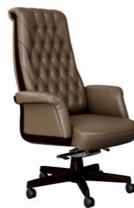
КРЕСЛО ИНТЕР Ш: 74 / Г: 53 / В: 131