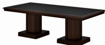
СТОЛ ПЕРЕГОВОРНЫЙ (INT701) Ш: 240 / Г: 117 / В: 76,8