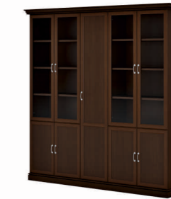
ДВА ШКАФА КОМБИНИРОВАННЫХ И УЗКИЙ ГАРДЕРОБ (INT504) Ш: 237 / Г: 49,3 / В: 240