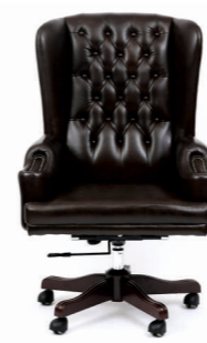
КРЕСЛО ЧЕЛЛИНИ (DL-051) Ш: 82 / Г: 80 / В: 130