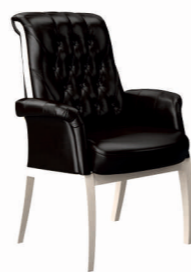
СТУЛ ИНТЕР G Ш: 75 / Г: 70 / В: 98