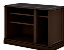
СТОЛ КОМПЬЮТЕРНЫЙ (INT106) Ш: 110 / Г: 55 / В: 76,8