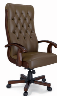
КРЕСЛО БОТИЧЕЛЛИ (DB-13) Ш: 70 / Г: 65 / В: 128