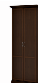
ГАРДЕРОБ (INT402) Ш: 102 / Г: 49,3 / В: 240