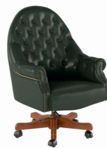
КРЕСЛО КАРПАЧЧО (DL-050) Ш: 65 / Г: 65 / В: 130