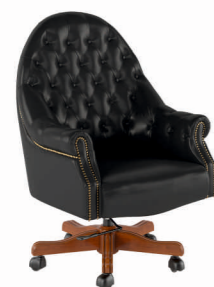
КРЕСЛО КАРПАЧЧО (DL-050) Ш: 65 / Г: 65 / В: 130