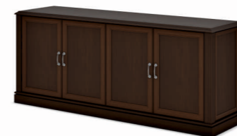
ГРЕДЕНЦИЯ 2000 (INT302) Ш: 200 / Г: 55 / В: 82,8 шпонированный топ