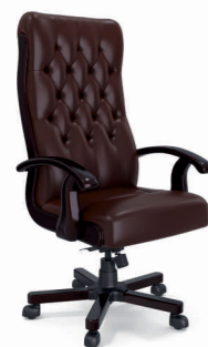
КРЕСЛО БОТИЧЕЛЛИ (DB-13) Ш: 70 / Г: 65 / В: 128