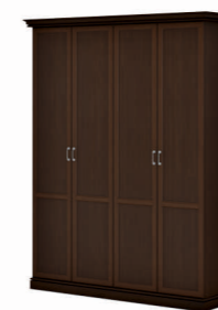
ДВА ГАРДЕРОБА (INT502) Ш: 192 / Г: 49,3 / В: 240