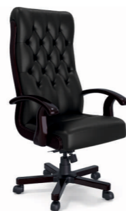
КРЕСЛО БОТИЧЕЛЛИ (DB-13) Ш: 70 / Г: 65 / В: 128